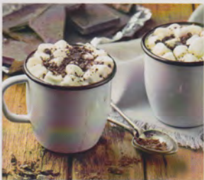
TRINKSCHOKOLADE FLÜSSIGES GOLD